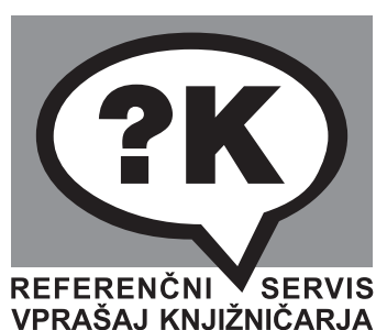
Slika 4: Črno-beli logotip