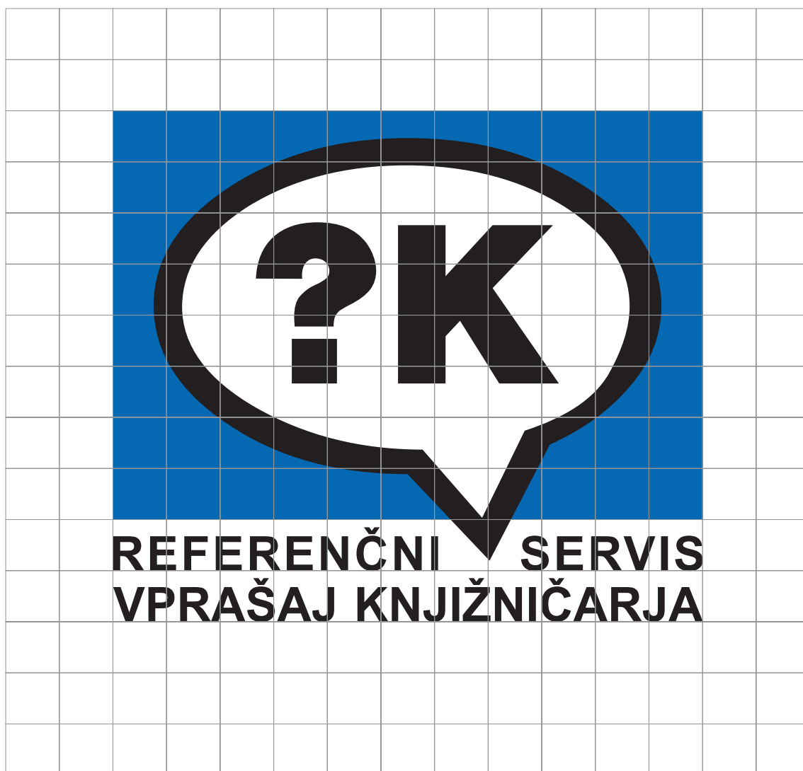
Slika 1: Konstruktivna mreža