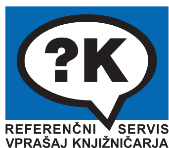
Slika 5: Barvni logotip